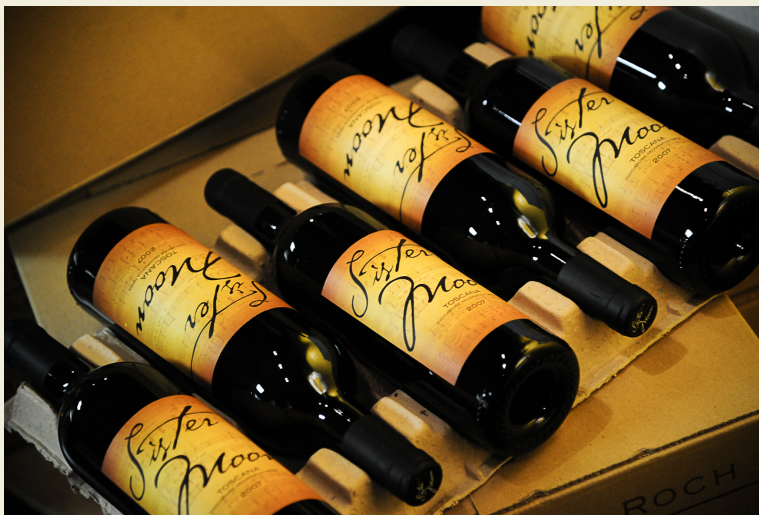
Sister Moon, vin de Toscane et vin de... Sting!

Retrouvez toutes les photos sur www.club.paperjam.lu